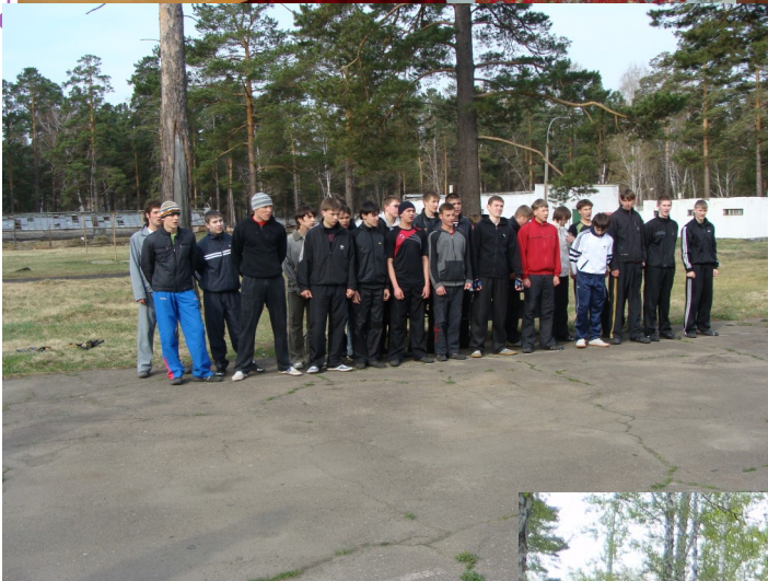
Сборы в военной части