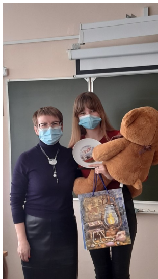
Ученик года 2019г.