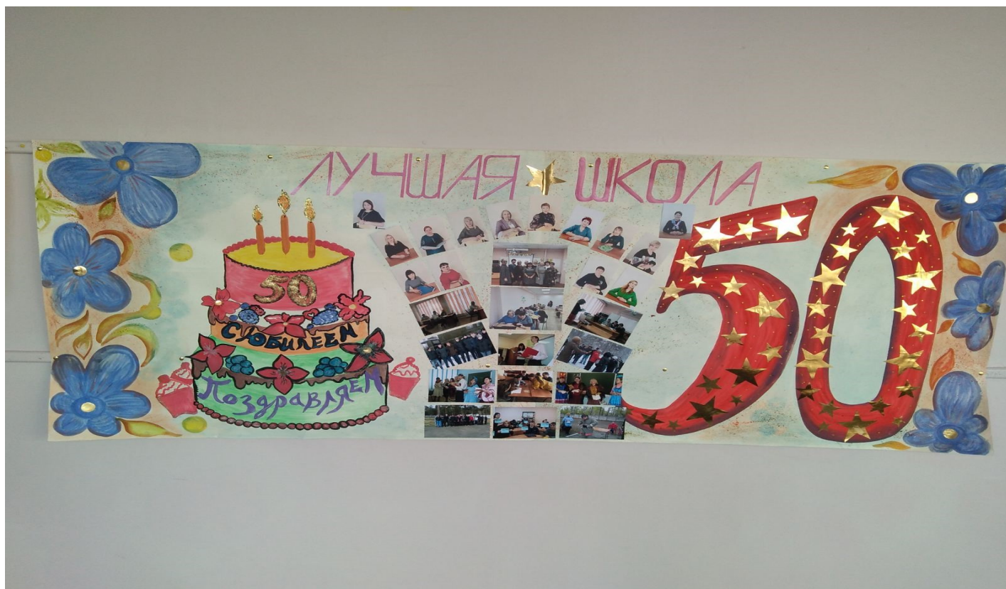
Поздравления от учащихся 9 «А» класса